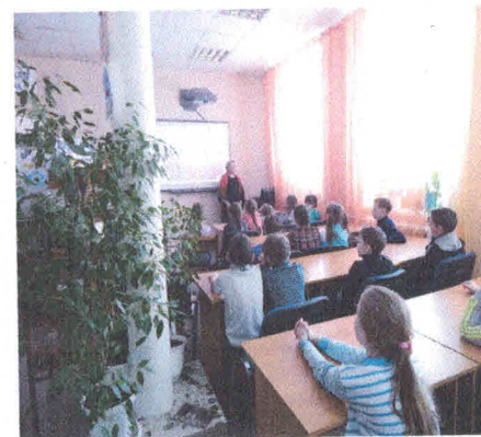
Посещение городской взрослой библиотеки Тема: «Мир права. Большие права маленького ребенка»