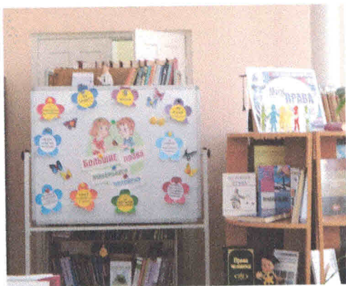
ФОТО-ОТЧЕТ о проведенных мероприятиях в рамках акции «СИНЯЯ ЛЕНТА АПРЕЛЯ – СИМВОЛ БОРЬБЫ С ЖЕСТОКИМ ОБРАЩЕНИЕМ НАД ДЕТЬМИ»